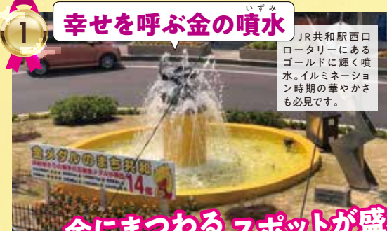
1 幸せを呼ぶ金の噴水

JR共和駅西口ロータリーにあるゴールドに輝く噴水。イルミネーション時代の華やかさも必見です。