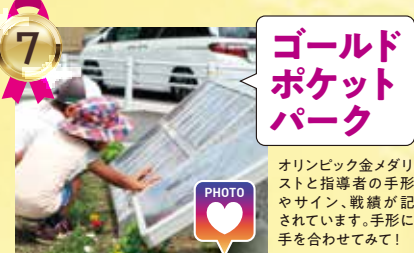
7 ゴールドポケットパーク

オリンピック金メダリストと指導者の手形やサイン、戦績が記されています。手形に手を合わせてみて!