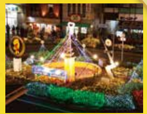
共和駅前イルミネーション