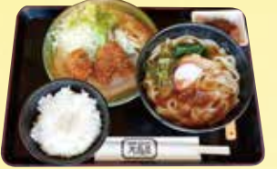
きしめん定食 詳細は店舗にお問い合わせください。

大府市共和町二丁目21-9 ☎0562-46-0637 共和駅から徒歩1分。名古屋名物きしめんや、うどん、そばなどメニューも豊富で、天ぷらやフライもサクサク。自家製麺が人気のきしめん定食は、魚のフライにサラダ、ごはんも付いて味もボリュームも大満足です。