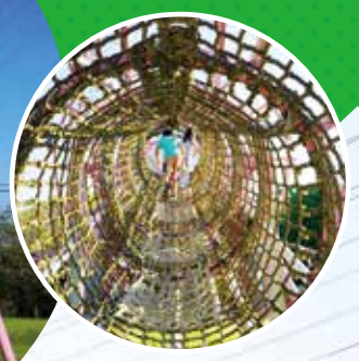
大府市北崎町大根2-193