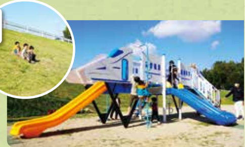
大府市若草町一丁目604

東海道新幹線沿いに位置し、新幹線モチーフの遊具が特徴的。土手滑りも童心に帰れます。辰池を囲む様々な草木を愛でながらお散歩してみてください。