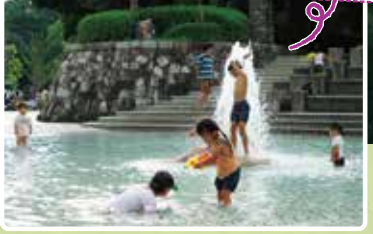
大府市共西町二丁目306

タイル敷きの広場。5mの噴水が噴き出すじゃぶじゃぶ池では、子どもたちが水遊びに興じます。階段を上がると、石をモザイク状に構築したパーゴラがあります。