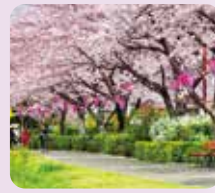
石ヶ瀬川緑道・ 鞍流瀬川緑道